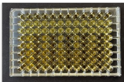
شکل شماره ۲- میکرو پلیت آزمون MIC پست بیوتیک‌ها

مقایسه خوانش کدورت در ۶۰۰ نانومتر این آزمون نیز به‌درستی تأیید کرد که رشد پاتوژن در حضور تیمارهای پست بیوتیک ۴۸ ساعته، کمتر از تیمارهای پست بیوتیک ۲۴