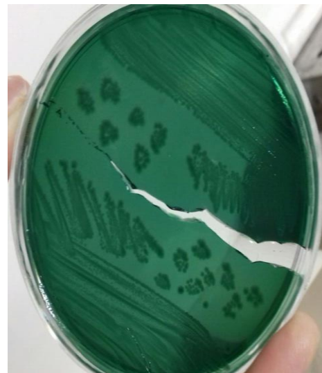
تصویر ۱، کلنی های V.parahaemolyticus بر روی محیط TCBSA