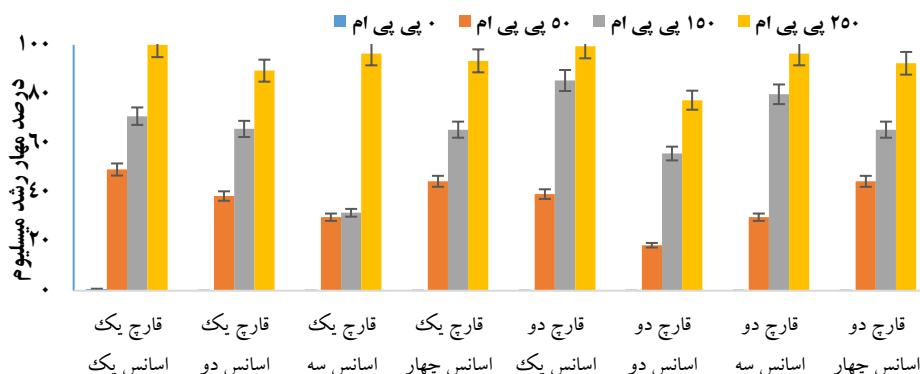
شکل ۳. اثر بازدارندگی غلظت‌های مختلف اسانس‌های زیره سبز (اسانس یک)، اسطوخووس (اسانس دو)، اکالیپتوس (اسانس سه)، آویشن باغی (اسانس چهار) و توانایی کنترل آنها علیه جدایه‌های قارچی (قارچ یک) F. oxysporum (قارچ دو) F. culmorum .